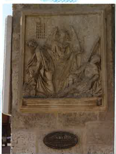
Placa "Me tomo las de Villadiego" y nivel