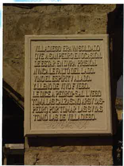
Placa "Me tomo las de Villadiego"